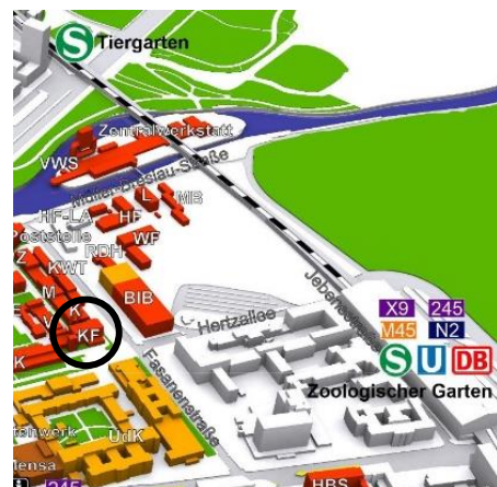
Abbildung 3: Campus Charlottenburg